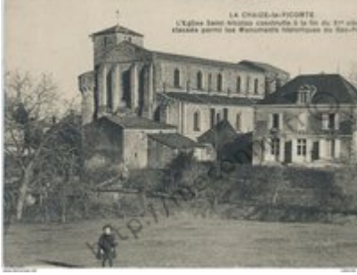
LA CHAZELLES-LE-PICOTTE L'Église Saint-Amand construite à la fin du 11 e siècle étendue par les Monnaies Henriques au 12 e siècle